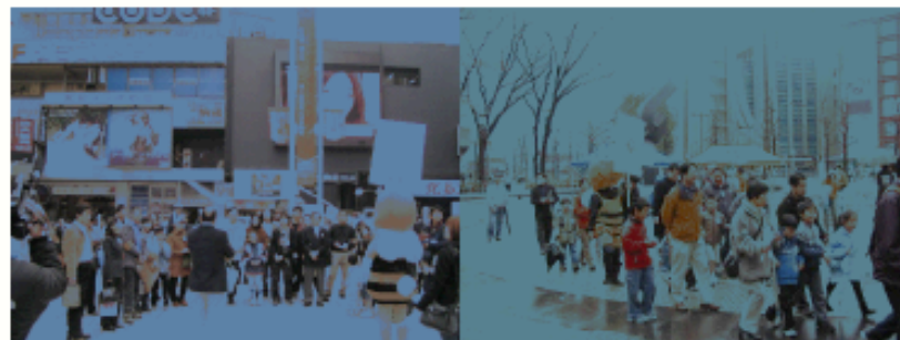
新宿キャンペーン (18.3.26) →歌舞伎町にて 池袋キャンペーン (19.3.25) →池袋西口公園

☆ 毎年3月の大会に合わせ、親子で街を歩きながら学ぶ「キャンペーン」を展開してきました