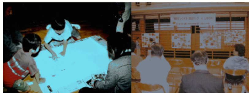
おやし東京主催による「安全マップ in 品川」(18.11.11) →品川区立三木小にて

☆ 地域の安全・安心のため、都内各地域で安全マップづくりを実施・応援してきました。