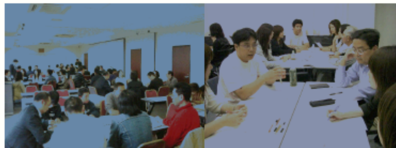
「おやしに聞こう！仕事のこと」(19.2.25) 「異世代コミュニケーション おやし×学生」(19.10.6)

☆ 若者と話し合うトークイベントは、現在なお発展中です。あなたも参加しませんか？！